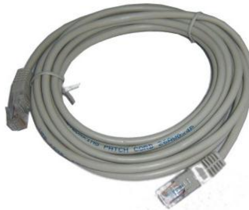
Cable de red