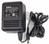
Conector de corriente