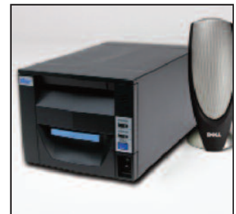
Herramienta de comunicación del usuario