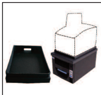
Escáner de montaje plataforma