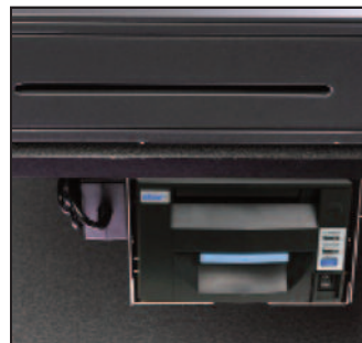
Para mostradores con espacio limitado