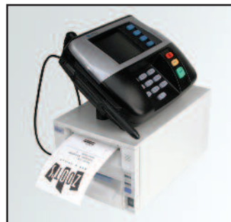
Habilitación de espacio diseño